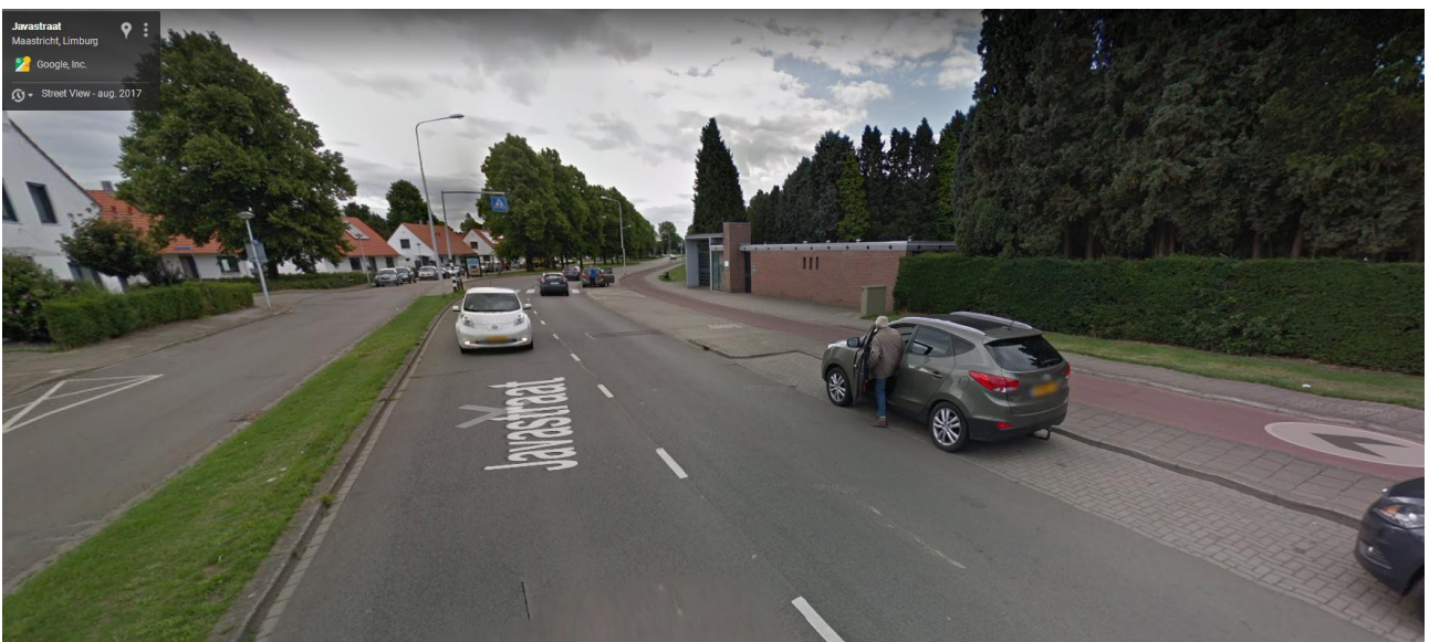
Hei zoot geer iemes in/oetstappe, de groutde vaan 'ne gemiddelde sjoon is 0.30cm