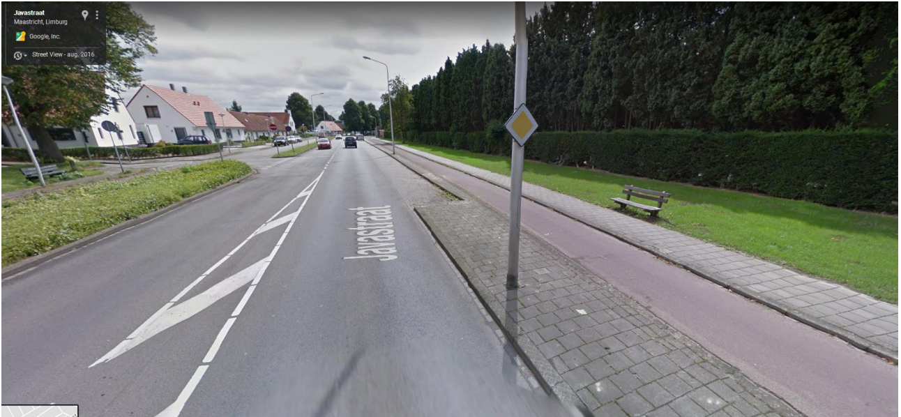
Ziech – Javastraat mèt Fietspaad rechts vaanaof kruising Plantehof